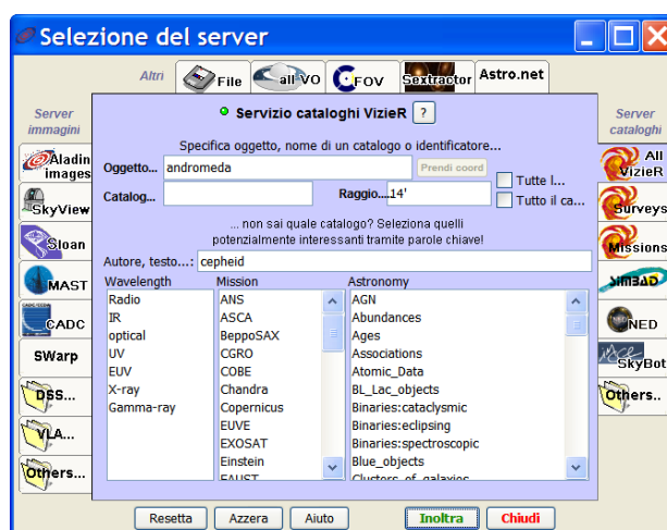
Fig. 1: Cercare le Cefeidi tra i dati VO.

File -> Apri poi scegliere „All ViZieR“ dal menu „server cataloghi“